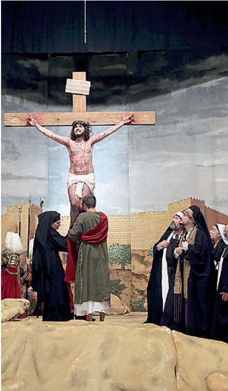
REPRESENTACIÓN DRAMÁTICA DE LA PASIÓN EL PABELLÓN DE DEPORTES ACOGE ESTA OBRA DESDE 1992