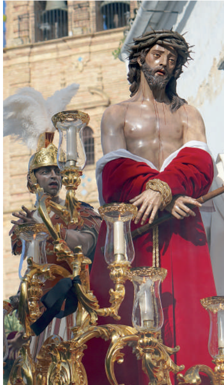
SANTÍSIMO CRISTO DE LA JUVENTUD LA TALLA ES OBRA DE MIGUEL ÁNGEL GONZÁLEZ JURADO