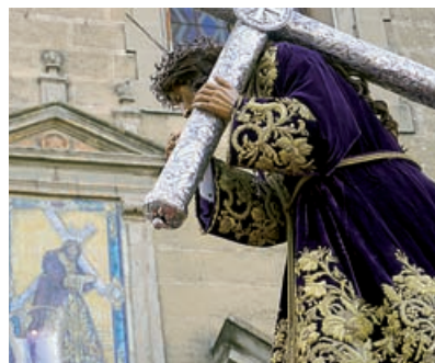
NUESTRO PADRE JESÚS NAZARENO EL «SEÑOR DE MONTILLA», JUNTO A SU AZULEJO

culares de esta cofradía, fundada en 1956 por un grupo de personas relacionadas con las bodegas, las vides y el vino.