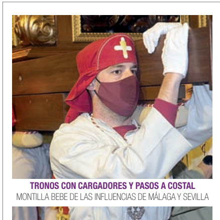
TRONOS CON CARGADORES Y PASOS A COSTAL MONTILLA BEBE DE LAS INFLUENCIAS DE MÁLAGA Y SEVILLA

En el otro extremo de la ciudad, en la barriada de El Gran Capitán, tiene lugar la salida penitencial de la Hermandad del Señor en la Santa Cena, María Santísima de la Estrella y Nuestra Señora de las Viñas, cuya sede canónica –la parroquia de La Asunción– congrega cada año a decenas de montillanos que no quieren perderse el ritual de saetas dedicadas a las imágenes ti-