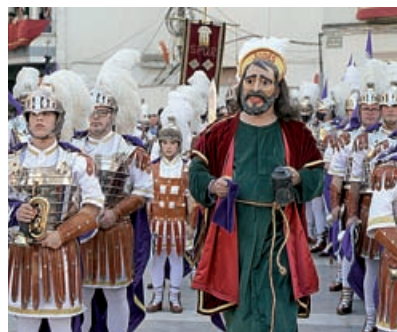
EL PRENDIMIENTO DE JESÚS LA FIGURA DE JUDAS SOBRESALE EL JUEVES SANTO